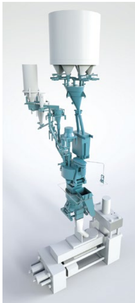
Abb. 2: Anlagenschema für die Aufbereitung von Graphitelektrodenmassen

Neben der Aufbereitung von Elektrodenmassen für die Stahlherstellung bietet Eirich auch wirtschaftliche Aufbereitungslösungen für die Aluminiumherstellung. Bei der Schmelzfluss-elektrolyse werden Anoden und Kathoden eingesetzt. Für die Kathodenaufbereitung im Chargenbetrieb kommen ähnliche Maschinen wie bei der Graphitelektrodenaufbereitung zum Einsatz, bestehend aus EWK, Mischer und Tellerheber als Pastenzuteiler. Anodenmassen