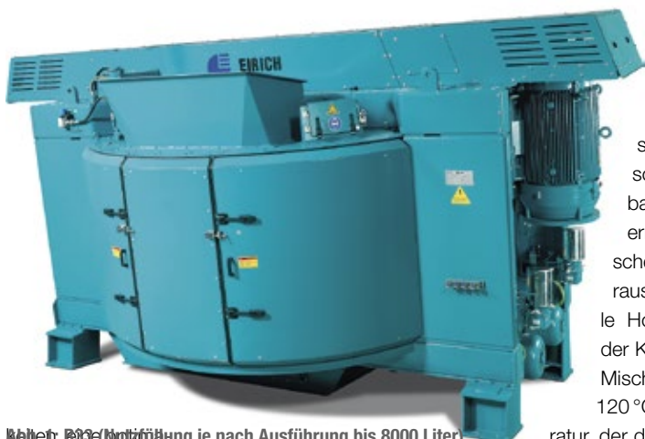
Abbildung 23: Eirich-Mischer je nach Ausführung bis 8000 Liter

In der Branche hat sich dank dieser Vorteile seit etwa 50 Jahren die Aufbereitung „Eirich-Mixer-Cooler“ genannten Mischern durchgesetzt. Weltweit vertrauen viele namhafte Hersteller hochwertiger Graphitelektroden auf diese Aufbereitungstechnik. Ein einzelner Mischer aus Hardheim kann bis zu 12 Kneter ersetzen. Die Produktivität steigt bis zu 200 %, bei niedrigen Investitions- und Instandhaltungskosten; die Anschaffungskosten amortisieren sich meist in wenigen Jahren.