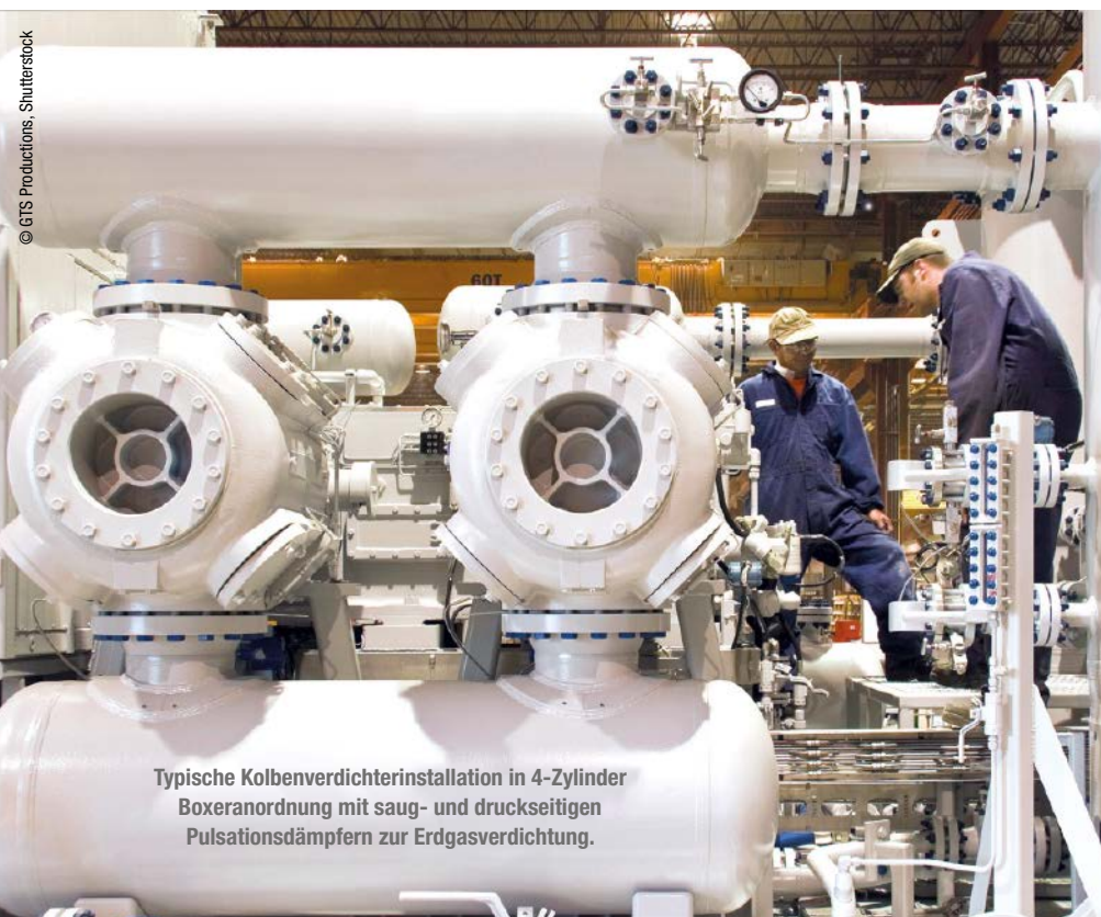
Typische Kolbenverdichterinstallation in 4-Zylinder Boxeranordnung mit saug- und druckseitigen Pulsationsdämpfern zur Erdgasverdichtung.

Eine Verdichtung von Wasserstoff mit einem Turboverdichter ist nur dann möglich, wenn die Schallgeschwindigkeitsdreiecke am Laufrad-Ein- und -Austritt gleichbleiben (Mach'sche Ähnlichkeit). Für reinen Wasserstoff wäre demnach ein viermal größerer Durchsatz sowie eine viermal höhere Drehzahl