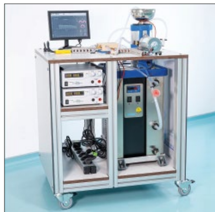
Abb. 3: Mobile Reaktoranlage für den Vor-Ort-Einsatz.