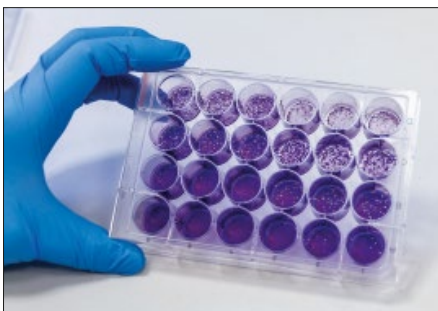
Abb. 4: Mit Virus-Infektionstests, z.B. einem Plaque- oder TCID50-Assay, untersuchen die Fraunhofer-Forschenden, ob die Luft nach der Inaktivierung noch infektiös und damit übertragbare Viren enthält.