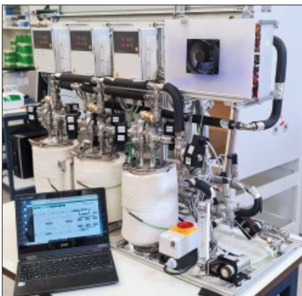
Abb. 2: Das Prinzip Virusgrill Apparat zur thermischen Inaktivierung Aerosolgetragener Viren.