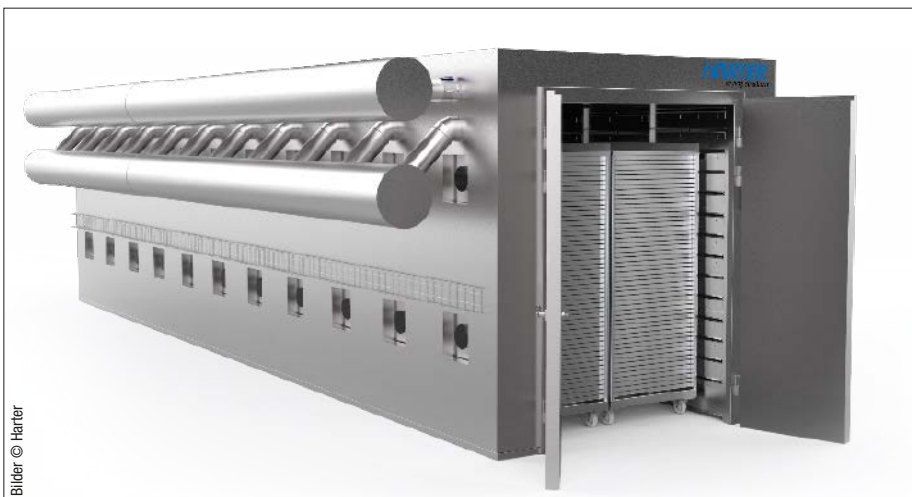
Der Trockner für die Pastillenproduktion besteht aus 11 Kammern und nimmt insgesamt 132 Palettengestelle auf. Die Nennleistung des Wärmepumpentrockner im Produktionsbetrieb liegt bei 33 kW.

zess laufen in einem geschlossenen Luftkreislauf ab. Luft und Wärme bleiben im System erhalten. Specht erläutert: „Bei diesem Projekt waren umfangreiche Versuchsreihen und viel Feinjustierung unserer Technik gefragt, um dieses gute und sichere Ergebnis zu erreichen. Unser Technikum ist unsere Ideenschmiede somit das Tor zum Erfolg.“