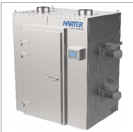
In diesem Trockenschrank werden die Fässer innerhalb von 30 min – eine Vorgabe des Kunden – bei 70 °C getrocknet und auf 40 °C gekühlt.

Wie bisher werden Kunststofftrays mit Stärke befüllt, darin die gewünschten Formen mittels Schablone hineingestanz und dann die geleeartige Flüssigkeit eingespritzt. Die Trays werden auf spezielle Paletten gestapelt. Diese werden anschließend in die Trocknungskammern eingefahren. Jede Kammer ist für die Beschickung von 2x11 Palettengestellen ausgelegt. Es stehen jeweils zwei Palettengestelle nebeneinander, somit 22 in der gesamten Kammer, 132