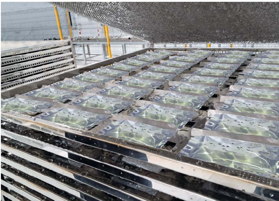
Die Infusionsbeutel liegen dicht an dicht in 21 Lagen übereinander. Mit extrem trockener Luft und der richtigen Luftführung ist es möglich, alle Beutel gleichzeitig und vollständig zu trocknen.