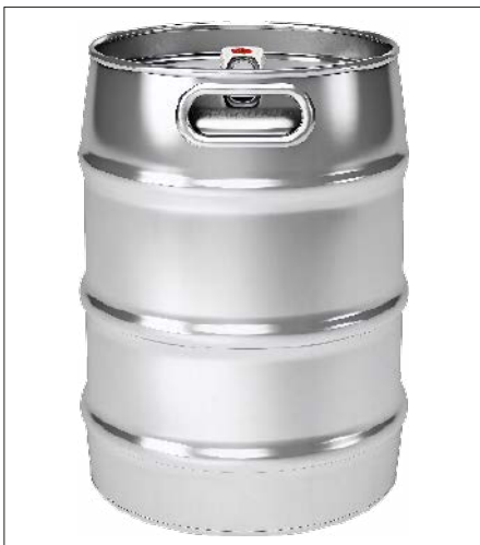
Bei diesen Edelstahlfässern waren ausgiebige Versuchsreihen notwendig, um eine technische Lösung für die Trocknung im Inneren zu finden.