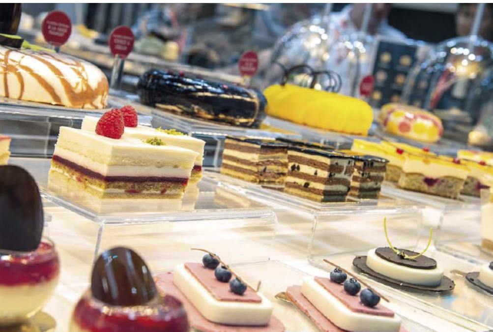
Abb. 1: Backwaren sind empfindliche Produkte, die gut geschützt verpackt werden müssen.

um Backwaren geht, während die Schwellenländer Osteuropas aufgrund der hohen Nachfrage nach Convenience-Food-Produkten insbesondere den Absatz von Keksen und Brot vorantreiben. Der europäische Backwarenmarkt sei dabei in Bezug auf die Lieferkette, die Produktpalette, die Vertriebskanäle und die Verbraucherpräferenzen gut etabliert.