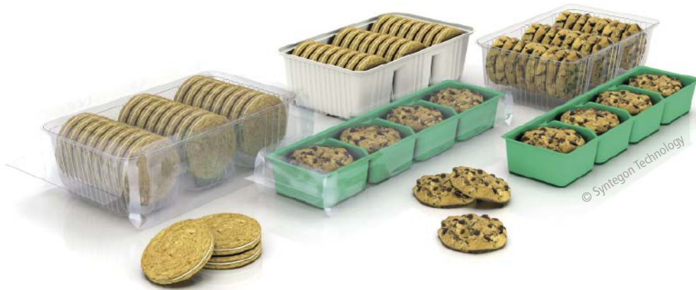
■ Abb. 3: Die Syntegon IDH Pick-and-Place Lösung bietet eine hohe Produkt- und Packstilflexibilität.