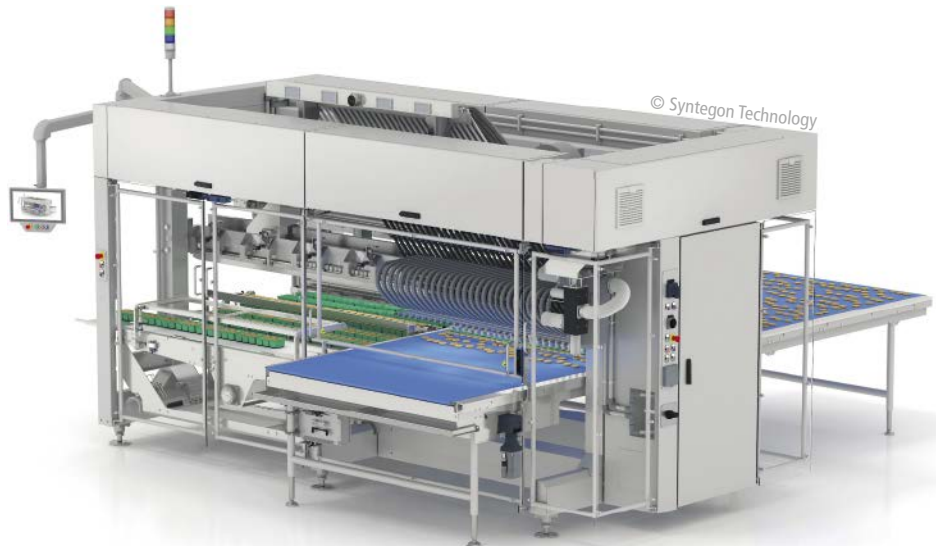
■ Abb. 2: Eine neu entwickelte Pickertechnologie auf Basis von Linearmotoren gewährleistet dank gleichmäßiger Bewegungen ein besonders schonendes Handling.

Auch in der Endverpackung werden Roboter eingesetzt: Ein Wiener Strudelteighersteller nutzt etwa zwei Stäubli-Roboter, um der steigenden Nachfrage nachzukommen. Zu den Besonderheiten der Linie gehören die hängende Anordnung der beiden Roboter sowie der Verzicht auf einen Schutzzaun. Die Roboter des Schweizer Herstellers verpacken im 1,5-Sekunden-Takt Strudelteig für die Gastronomie: jeweils vier in Folie verpackte Gebinde mit zwei Blättern à 125 g Gewicht kommen in einen Karton. Dabei greift der eine Roboter die folienverpackten Einheiten, während der andere den Karton vorbereitet.