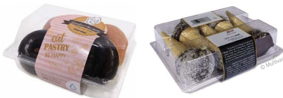
■ Abb. 5: Full Wrap-Lösung reduziert den Materialeinsatz beim Etikettieren von Klappschalen.

Druckempfindliche Backwaren wie Kleingebäck, Muffins, Donuts, Tortenstücke oder ganze Kuchen werden häufig in solchen transparenten Klappschalen verpackt und diese üblicherweise von einer Kartonbänderole umschlossen. Mit dem Transportbandetikettierer von Multivac soll im Vergleich zu einer Kennzeichnung mit Kartonbänderole eine Materialeinsparung von bis zu 70 % möglich sein. Das Modell mit den servotriebenen Andrückbürsten ermöglichte die C- und D-Etikettierung von bis zu 120 Packungen pro Minute bei Etikettenbreiten von bis zu 500 mm.