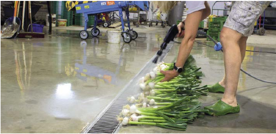
© Aschl (eine Marke der 1A Edelstahl GmbH)

■ Abb. 2: Damit das Waschwasser auch bei erhöhtem Grobschmutzanteil kontrolliert abgeführt wird, setzt der Meindlhof auf die Kastenrinne von Aschl. Das große Seiten- und Längsgefälle der Rinne sorgt für eine hohe Abflaufleistung.