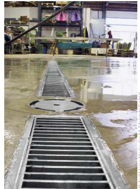
© Aschl (eine Marke der 1A Edelstahl GmbH)

Sämtliche Komponenten der Entwässerungstechnik von Aschl bestehen aus rostfreiem Edelstahl – einem der hygienischsten Materialien. Die spezielle Bauform der Aschl-Produkte, bei der es keine versteckten Räume gibt, wo sich Schmutzreste ansammeln könnten, sorgt ebenfalls für eine hygienische Entwässerung und einfache Reinigung. Besonders der runde und „totraumfreie“ Bodenablauf Eurosink Junior ist hier hervorzuheben. Die Feststoffe sammeln sich kontrolliert in den integrierten Schmutzfangkörben und können so einfach entsorgt werden. Ein Geruchsverschluss schützt vor möglichen, unangenehmen Gerüchen.