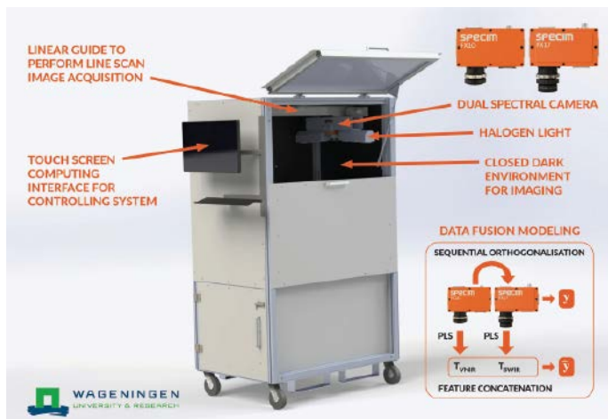
Abb. 2: Eine Illustration des All-in-One-Spektralkabinetts mit zwei Spektalkameras FX10 und FX17 von Specim. Die Datenmodellierung wird mit speziell entwickelten Datenfusionsmethoden durchgeführt.

ermöglichen, Aufgaben ohne Vorkenntnisse im Bereich des maschinellen Sehens zu lösen. Für die hyperspektrale Bildverarbeitung existieren solche bedienerfreundlichen Bildverarbeitungssysteme bisher jedoch nicht. Um diese Situation zu ändern, wollten die Forscher ein einfach zu bedienendes One-Touch-System entwickeln. Ziel des Projekts war es, ein intelligentes All-in-One Spectral Imaging (ASI) Laborsystem für die standardisierte automatisierte Datenerfassung und die Bereitstellung von Spektralmodellen in Echtzeit zu realisieren, um die hyperspektrale Bilderfassung zu vereinfachen.