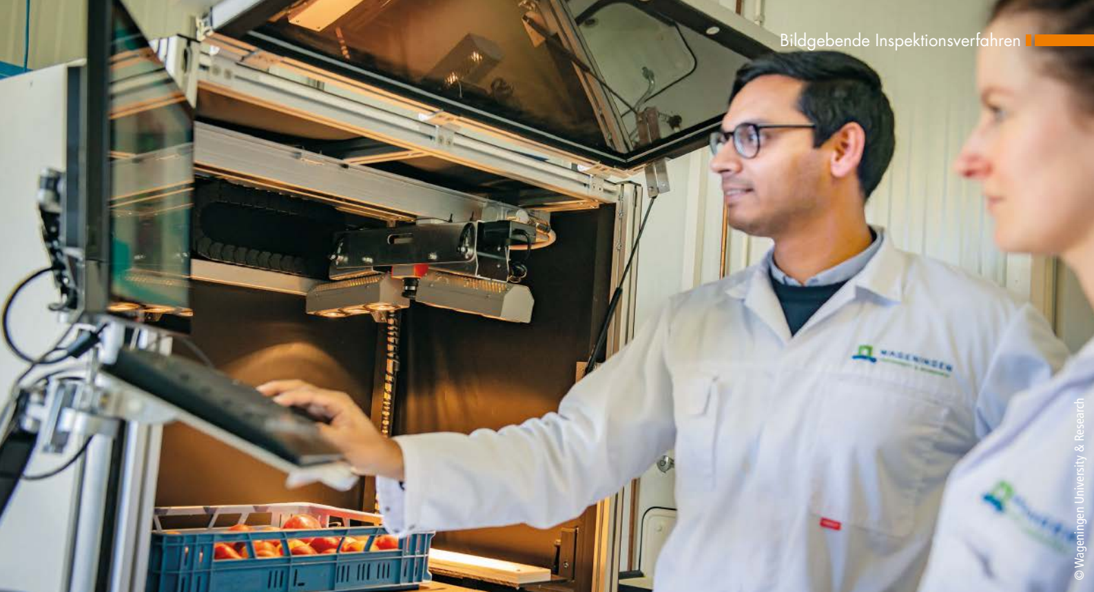
■ Abb. 1: Das intelligente All-in-One Spectral Imaging (ASI)-Laborsystem hat seine Zuverlässigkeit bei der Vorhersage von Eigenschaften diverser Früchte bewiesen.