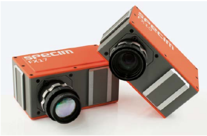
■ Abb. 5: Die Hyperspektralkameras FX10 und FX17 von Specim sind die Schlüsselkomponenten für das Obstinspektionssystem und decken einen Wellenlängenbereich von 400 bis 1.700 nm ab.

bereich von 900 bis 1.700 nm ab. Dies eröffnete weitere Möglichkeiten für die Analyse von Lebensmitteln, aber auch von anderen organischen Objekten.