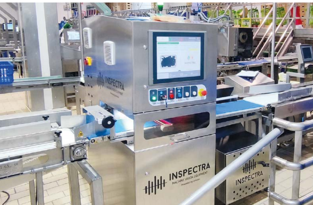
■ Abb. 1: Der Thermoseal & Label Inspector entwickelt vereint anspruchsvolle Technologien wie Hochgeschwindigkeits- und Verarbeitungserfassung mit der Inspectra HSP-Technologie, hyperspektraler Bildverarbeitung, Deep Learning und Leistungsstärke im Rot-Grün-Blau-Farbraum (RGB).