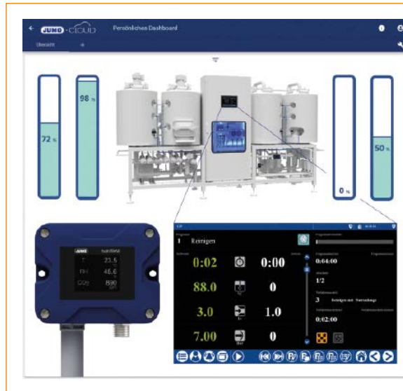
■ Abb. 2: Von Maischen und Abläuern über das Würzkochen und -kühlen bis hin zur Gärung und Filtration – alle Prozesse können mit der Jumo-Lösung effizient gesteuert werden.

Jumo hat mit dem Varitron 500 und dem Jumo Smartware Program eine umfassende und intuitive Automatisierungslösung geschaffen, die in vielen Industriezweigen eingesetzt werden kann, insbesondere in der Brauindustrie. Die Lösung bietet nicht nur die Möglichkeit, die verschiedenen Prozessschritte der Bierherstellung effizient und präzise zu steuern, sondern