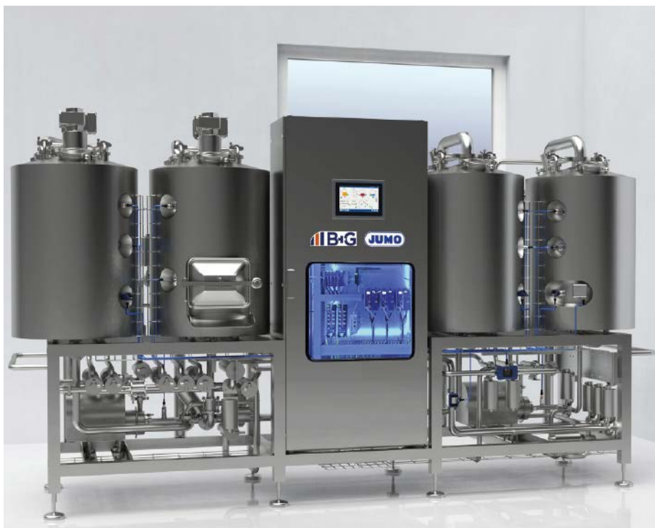
Abb. 1: Brauanlage: In der Lebensmittelindustrie, z. B. beim Brauprozess, spielt die Verfahrenstechnik Anwendung von Jumo eine entscheidende Rolle.

Bei der Reinigung sind die Temperatur, der Durchfluss, die Konzentration der Reinigungsmedien und die Dauer der Reinigung die wesentlichen Faktoren für den Reinigungserfolg. Je höher